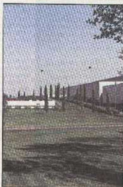
Drveće na «zelenom» mostu. Zanimljivo rješenje na mostu koji premošćuje cestu - oblikovani park s posađenim žlicama i drvećem

nim klopama za odmor posjetitelja u ugodnu ambijantu.