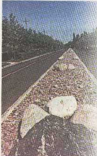
Jedan od vanjskih prilaza EXPO-u - graničnik između dvaju smjerova ceste, koji je najčešće zasijan travom ili posađen žlicom, ovdje je uređen u «suhi kameni pctok»

Priprema terena za sadnju biljaka, te za postavu ostalih vrtnih elemenata, a koju smo pratili postepeno tijekom izvođenja radova, prema najvišim je hortikulturnim standardima, bez imalo improvizacija koje ponekad prate ovakve izložbe na kojima je potrebno pokazati puni sjaj samo nekoliko mjeseci. Ovdje se i te kako razmišljalo da parkovi ostaju i nakon izložbe, te da svaki najmanji detaljić mora biti posve doteran.