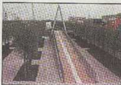
Pogled na «Vrt promjena» s valovitim mostom-skulpturom