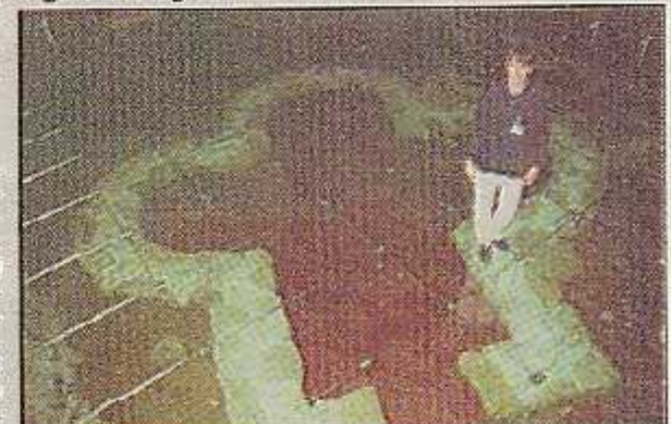
Replica starohrvatske crkvice

zemlja u vrećama, te biljke doradivani pojedini detalji - u Ukrajnu, na EXPO u Hannoveru dopremljena su iz Hrvatske ukupno 4 tegljača pripremljena materijala! Sav je materijal nakon unošenja u paviljon slagan prema naktu, te pažljivo branžiran tako da je svaki pojedini dio tla posebno slagan, pa su doradivani pojedini detalji - u zelenu livadu slagalo se poljsko cvijeće, aranzirala se šuma sa svim šumskim elementima, u morski dio postavljale školjke, amfore, oblikovala stjenovita obala. Ukupno je dopremljeno i posloženo 80 tona materijala!