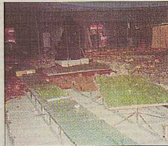
Izrada hrvatskog tla - doprema i slaganje pripremljene trave za livadu

O hrvatskom paviljonu na svjetskoj izložbi EXPO 2000. u Hannoveru mnogo je pisano i prije otvaranja, a sjedećih pet mjeseci koliko traje EXPO, posjetiteljima izuzetan doživljaj. Po Siladinovoj ideji prikazuje karakteristične odlike tla naše zemlje, i to po segmentima - tla sjeverna i srednje Hrvatske s oranicom, livadom s poljskim cvijećem, rascvjetanim poljem uljane repice, šumskim tlom, zatim karakteristično tlo zemlje crvenice, rascvjetalo polje lavande, vinograd i segment primorske vinograde sa suhozidovima, kršku golet, vršes u kršu, kršku polje unutar suhozida, crnogorična šuma, te more - vodene površine sa sjevernom obalom, morskim stjenkom, školjkama i arheološkim elementima.