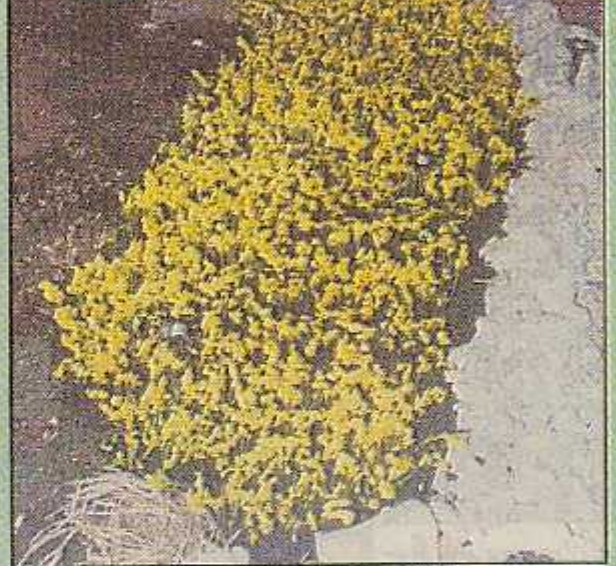
Detalj žutoj polja rascvjetane uljane repice

Sav je materijal nakon unošenja u paviljon slagan prema naktu, te pažljivo branžiran tako da je svaki pojedini