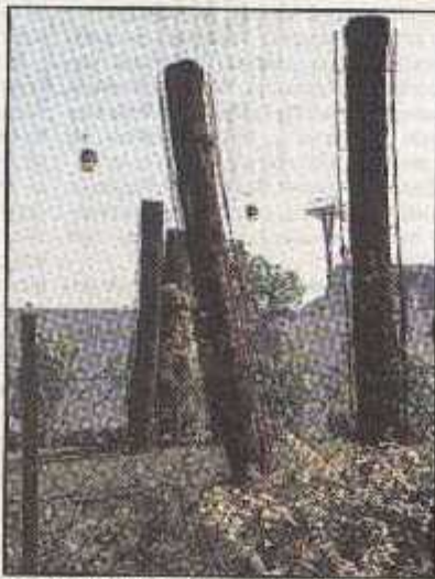
Zanimljivo rješenje s golemim trupcima posađena drveća ugrađenim u zemlju, kako bi simulirali staru posječenu šumu. Na trupce su pričvršćene metalne konstrukcije, te su uz njih posađene perjačice koje će ih obrastati