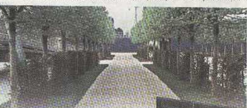
Detalj «Vrt promjena» - drvoređi lipa s podrastom od grabovce žlice na podlozi od travnata soga